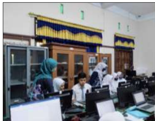
Gambar 3. Tanya Jawab Pelatihan KTI

Gambar merupakan salah satu unsur utama dalam karya ilmiah. Hal ini berkaitan dengan kemampuan penulis dalam mengungkapkan ilustrasi yang sangat baik. Untuk gambar, selain gambarnya sendiri, keberadaan caption juga harus diperhatikan yang bisa penulis gunakan dengan menggunakan fitur subtitle di Microsoft Word . Selain caption , caption juga digunakan untuk memberikan informasi mengenai tabel, sehingga caption dapat tetap konsisten. Pembicara juga menjelaskan cara menggunakan opsi kompresi untuk mengatur ukuran gambar sesuai kebutuhan untuk menghindari ukuran file menjadi terlalu besar. Terakhir, pemateri menjelaskan cara membuat daftar isi, gambar, dan tabel secara otomatis, karena jika dibuat secara manual jelas membosankan. ini menggunakan fitur gaya dan label, sehingga dapat membuat daftar isi secara otomatis. Fungsi-fungsi yang akan digunakan terletak pada menu referensi, menu daftar isi dipilih untuk daftar isi, dan menu Sisipkan Gambar untuk gambar dan tabel. Saat berpindah halaman, daftar isi dan daftar gambar dan tabel diperbarui. Materi-materi di atas diberikan dalam bentuk demonstrasi langsung yang dapat diikuti langsung oleh peserta lokakarya. Pemanfaatan fitur-fitur yang dijelaskan di atas mungkin diperlukan agar penulis dapat membuat laporan dengan file yang lengkap dan utuh. Setelah pemberian materi akan dilakukan sesi tanya jawab.