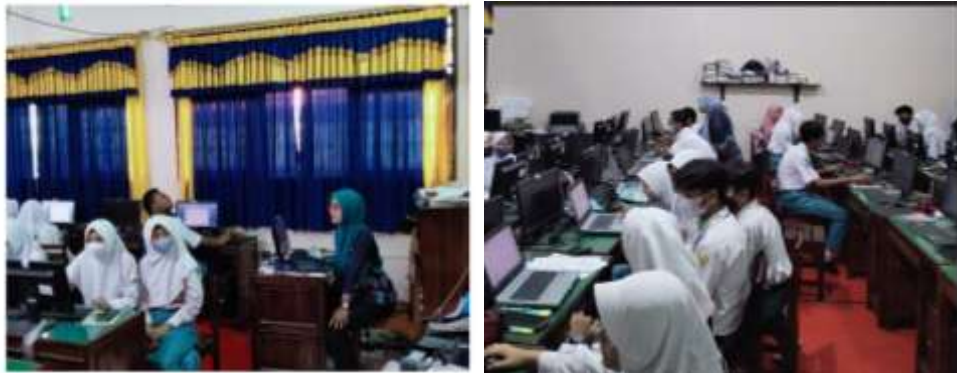
Gambar 2. Kegiatan Pelatihan KTI